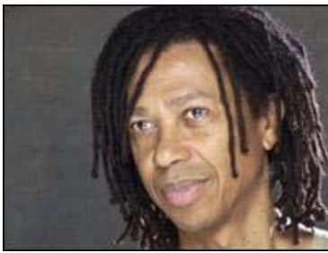
Djavan: 'Me sinto indubitavelmente negro em tudo'

O cantor Djavan disse que o resultado do exame de DNA que indica que ele é 65% africano, 30,1% europeu e 4,9% ameríndio "bate" com o que ele sente.